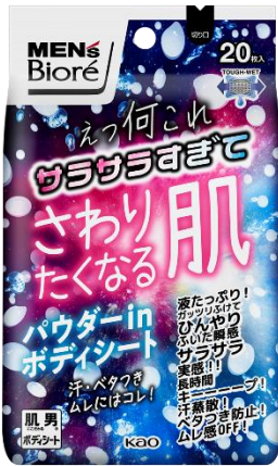
ドン・キホーテ風デザイン