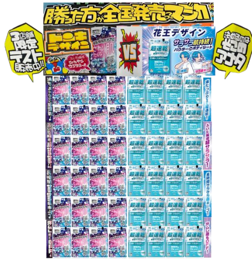
限定コラボ棚イメージ