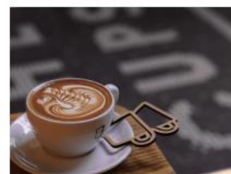
THE CUPS / FULLNESS OF TIME