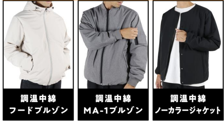
調温中綿 フードブルゾン