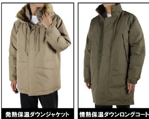
発熱保温ダウンジャケット