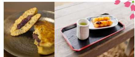
※画像はイメージです。実際に提供するメニューとは異なります

加えて、ご購入いただいた総菜や、屋台風で提供するから揚げ・揚げたこ焼き等をその場でゆっくり召し上がられるよう、店内にイートインスペースを 112 席設置します。この他、ムスリムフレンドリーの甘味処も設け、ぜんざいやどらやき等の、あずきを使った日本のデザートを中心に提供します。