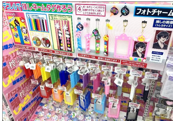
▲「推し活スティック」他店イメージ

施設周辺にはコンサートやライブ会場が10会場以上設営されているため、イベントをさらに楽しんでいただけるよう、ライブ参戦に必須のアイテムを多数用意。暗間で“推し色”に光るルミカライトや、自身が“推し色”に染まれるカラフルなヘアカラー剤も豊富に扱います。このほか、ファッションの一つとして持ち歩きたくなるような、推しの写真やカードを入れるかわいいケースなどのアイテムを取り揃え、推しへの愛情とともに“あざとかわいい”自分を表現できる商品を展開します。