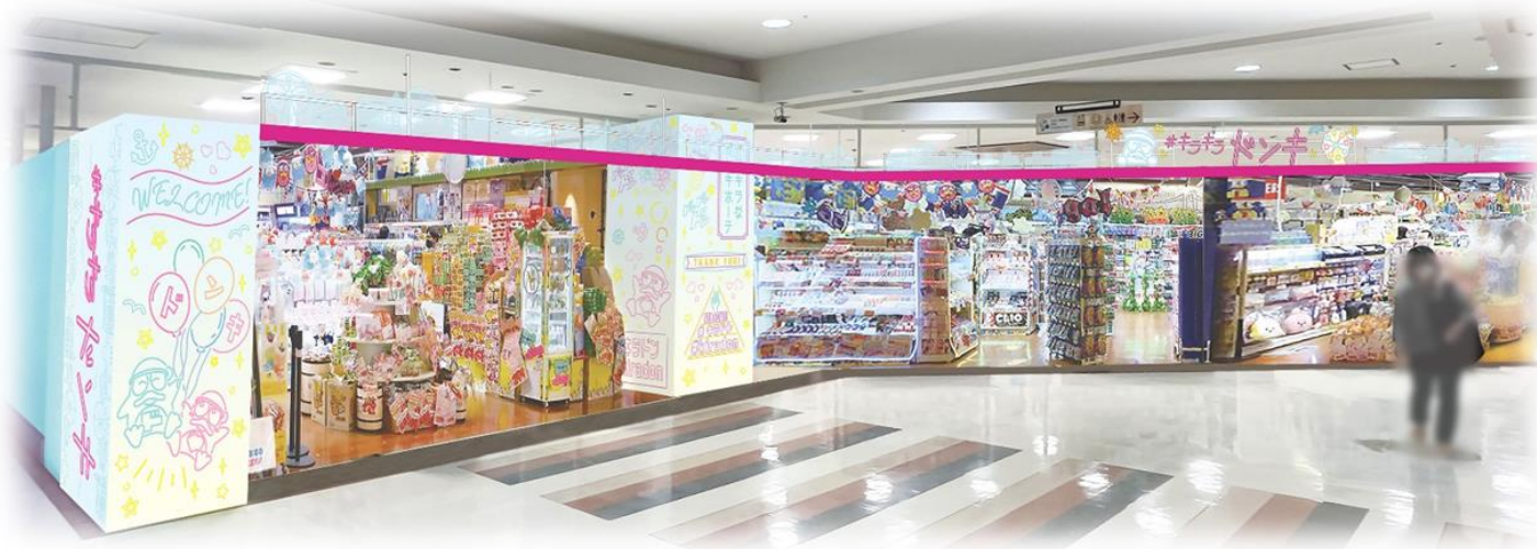
▲キラキラドンキ横浜ワールドポーターズ店 外観イメージ

株式会社ドン・キホーテ(本社:東京都目黒区、代表取締役社長:吉田直樹)は、2024年4月23日(火)に、「キラキラドンキ横浜ワールドポーターズ店」(神奈川県横浜市中区)をオープンします。主にZ世代向けの商品を扱う専門店型の業態「キラキラドンキ」は全国で4店舗目の出店です。